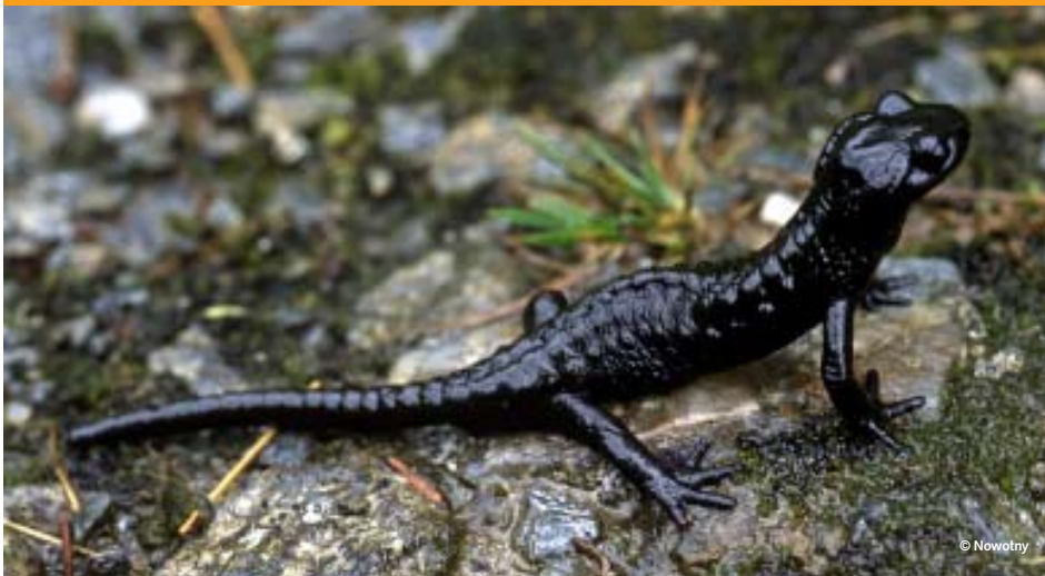
Alpensalamander ( Salamandra atra )

Der Alpensalamander kommt in Salzburg bis in 2500 m Höhe vor und ist als einzige Amphibienart zur Fortpflanzung nicht auf ein Gewässer angewiesen. Nach 2-3 Jahren Entwicklungszeit kommen zwei fertig entwickelte Jungtiere zur Welt. Das Hauptverbreitungsgebiet dieser Art ist der Alpenbogen.