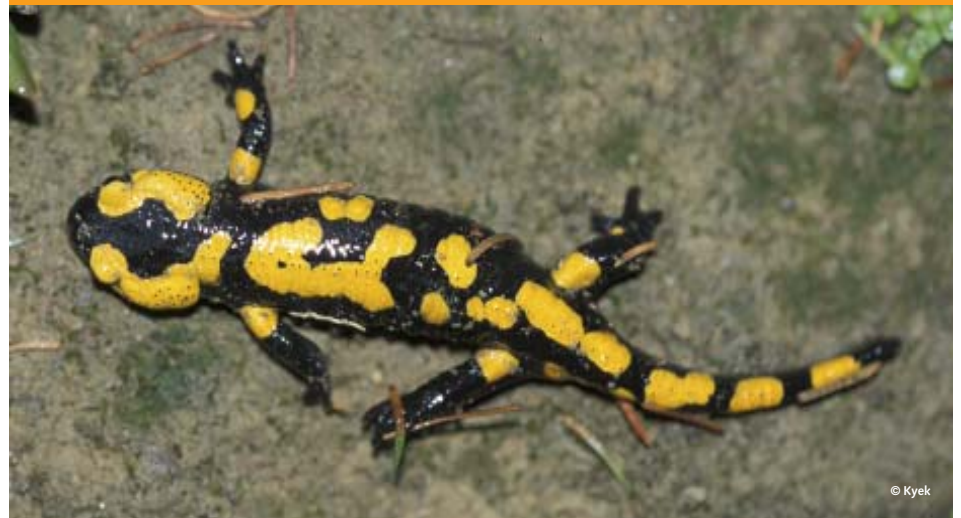
Feuersalamander ( Salamandra salamandra )

Der Feuersalamander, auch „Regenmandl“ genannt, setzt seine fertig entwickelten Larven in rasch fließenden sommerkalten Bächen ab und kommt in Salzburg vor allem in den Buchenwäldern entlang des Salzachtales, im Salzkammergut und rund um den Gaisberg vor.